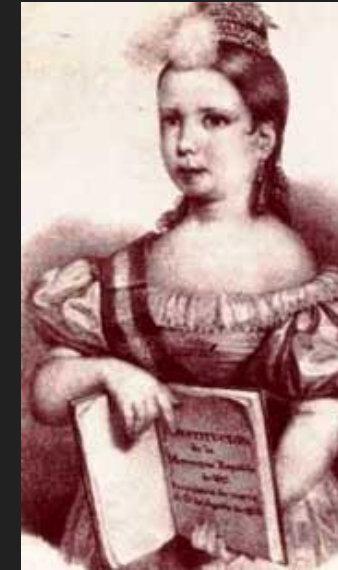
Isabel, filla de Ferran VII, als 6 anys.