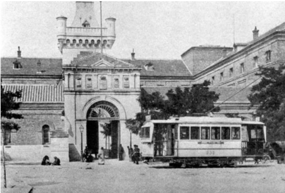
Antiga Presó Model de Madrid, l'any 1936.

Malgrat que sovint aquestes pràctiques tenien motivacions polítiques, també van existir txeques que van realitzar els seus actes simplement per incautar-se dels bens personals (diners en metàl·lic, joies, ...) de les seves víctimes.