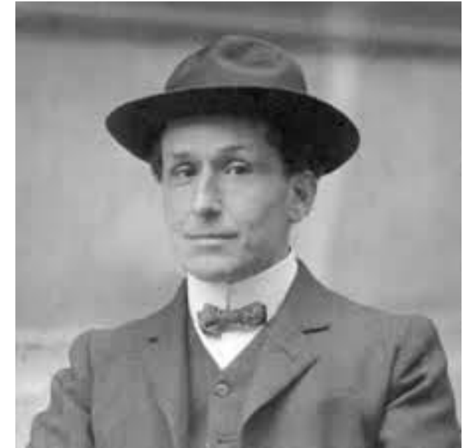
Pompeu Fabra i Poch, filòleg (1868 – 1948)). Va ser Autor de la Gramàtica Catalana.

Impuls a la renovació i modernització pedagògica . Creació d'Escoles del treball i industrials, les Escoles Normals (de formació de mestres), Experimentals, etc.