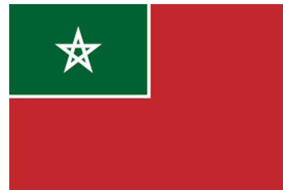
Bandera del Protectora espanyol del Marroc