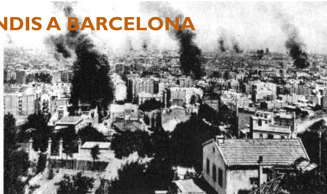
El miércoles de la Semana Trágica se suceden en Barcelona numerosos incendios de iglesias y conventos.

Les forces d'oposició al Govern (anarquistes, socialistes ...) van sumar-se a la insurrecció declarant la vaga general .