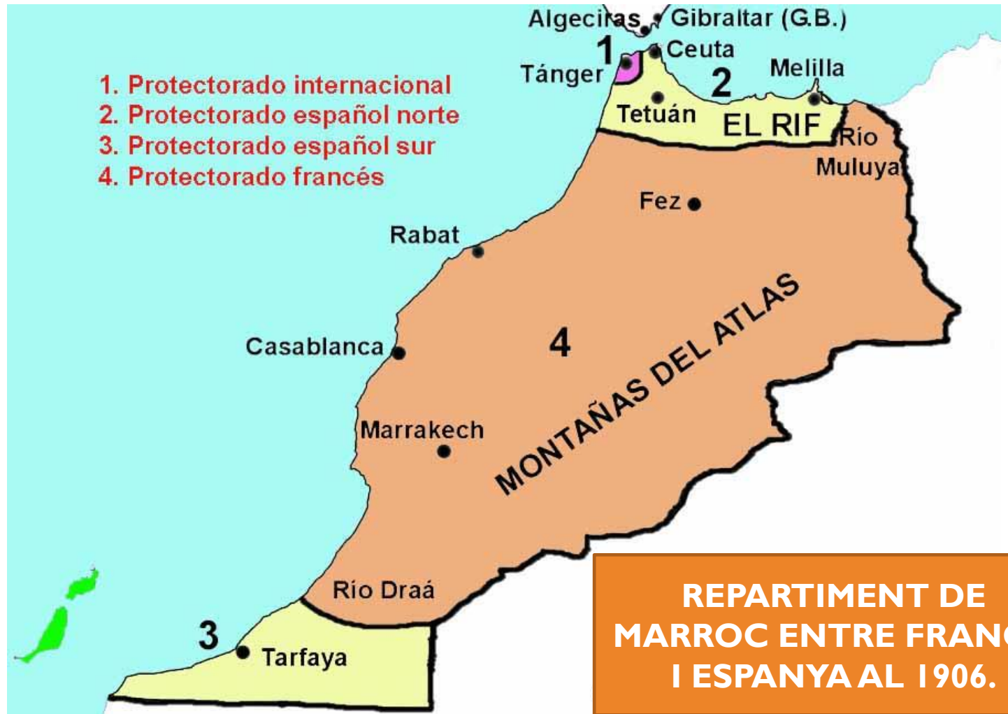
REPARTIMENT DE MARROC ENTRE FRANÇA I ESPANYA AL 1906.

Tractat entre Espanya i França (novembre de 1912, que establia els límits dels dos Protectorats.