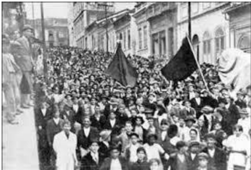
Imatge d'una vaga obrera a inicis del segle XX