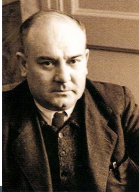
Joan Peiró (1887 – 1942)