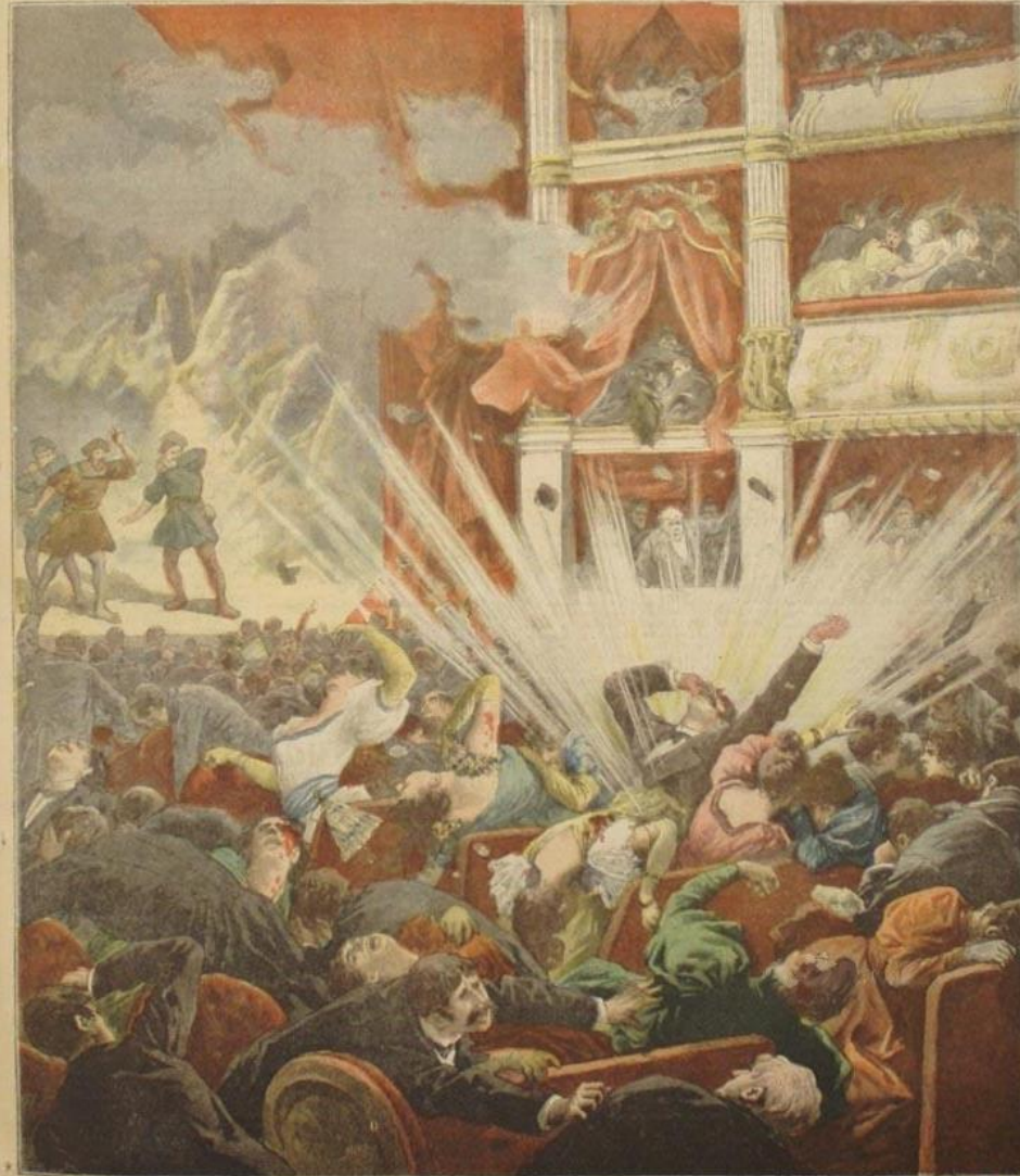
LA DYNAMITE EN ESPAGNE

Explosion d'une bombe au théâtre du Liceo à Barcelone