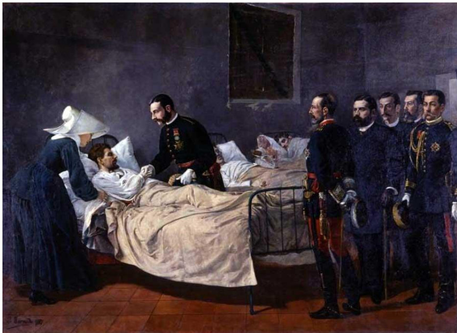
Aquest quadre representa el rei Alfonso XII visitant un hospital a Aranjuez amb malalts de còlera, l'any 1885.

Ambdues formacions polítiques van mostrar un ampli acord ideològic en la sustentació del règim de la Restauració, i van mantenir polítiques econòmiques i socials molt similars.