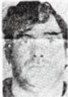
Angel Obispo Echegarai

Els últims afusellaments del règim de Franco van produir-se el 27 de setembre de 1975. Foren 3 militants del FRAP i 2 d'ETA, després de 3 consells de guerra sumaríssims a Burgos, Madrid i Barcelona.