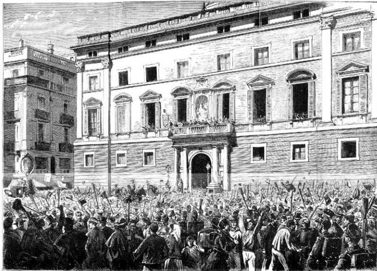
BARCELONA.—Proclamación de la república: aspecto de la plaza de San Jaume en la mañana del 21 de Febrero.

La PRIMERA REPÚBLICA ESPANYOLA va durar només 11 mesos, del febrer de 1873 al gener de 1874, i va tenir 4 presidents diferents.