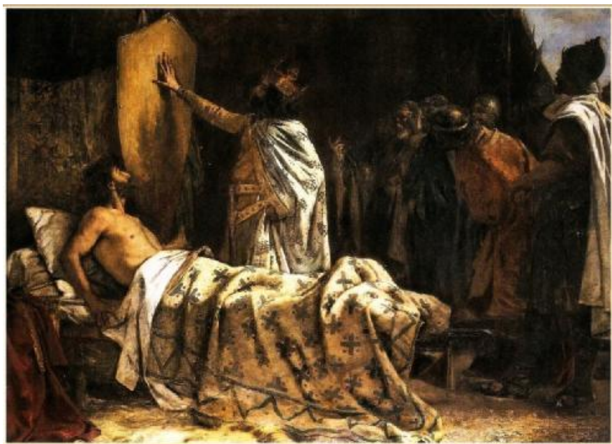
La llegenda de Guifré el Pilós i les "quatre barres"

EL ROMANTICISME, com a moviment artístic i cultural, va néixer al Regne Unit i a Alemanya a finals del S. XVIII i es va estendre per tota Europa a partir de 1820, després de les guerres napoleòniques.