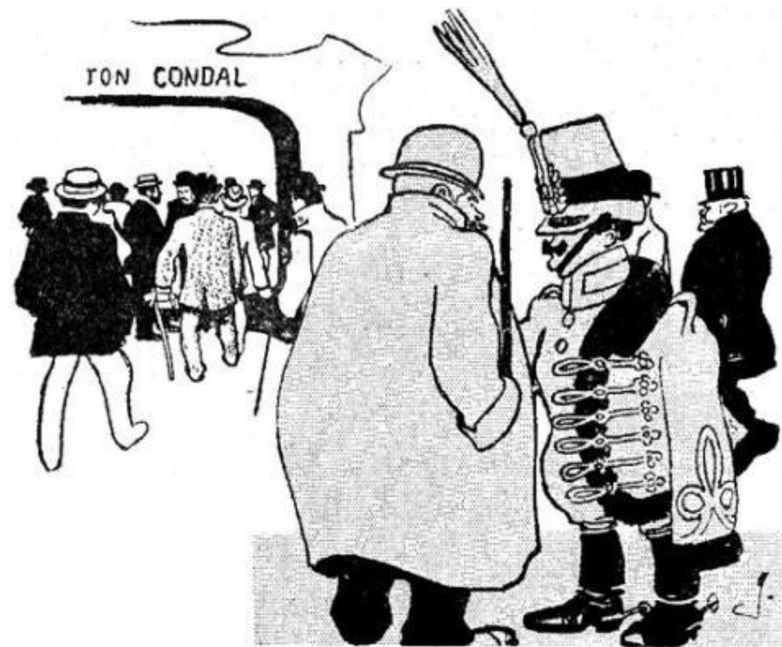
AL FRONTÓN CONDAL