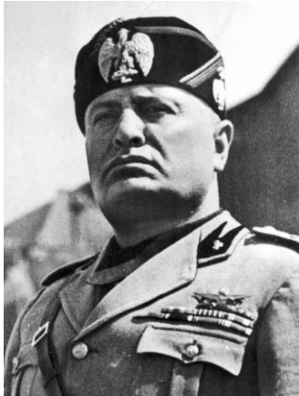
Benito Amilcare Andrea Mussolini 1883 – 1945. "Duce" d'Itàlia entre 1922 i 1943.

Època entre 1919 i 1944 a Itàlia, en que va néixer i va arribar al poder la ideologia feixista , liderada per Benito Mussolini , que va crear un Estat totalitari i, aliat amb l'Alemanya nazi, va provocar la Segona Guerra Mundial .