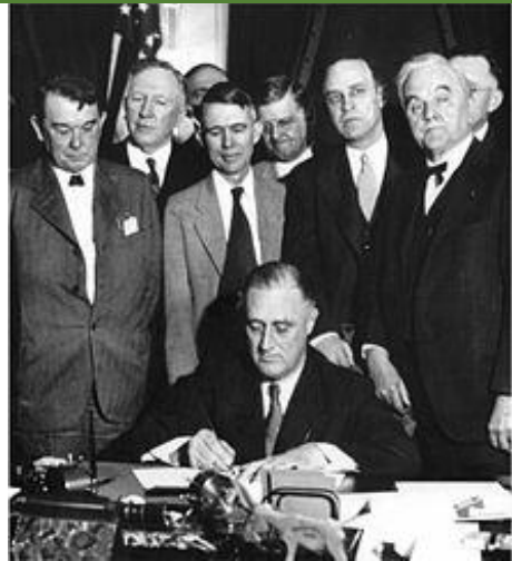
El president Roosevelt signant les lleis de la New Deal .

Objectius de reactivació de l'economia americana ↓